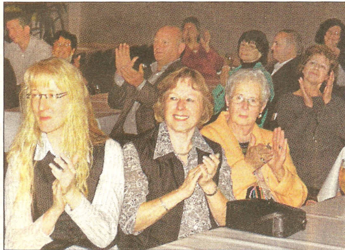
Die Zuhörer im Haus des Gastes waren begeistert von den Darbietung der Musiker und erklatschten sich zwei Zugaben.

Gleich zu Beginn des Konzertabends verzauberten die Musiker ihr Publikum mit dem monumentalen Marsch bei der „Parade der Wagenlenker“ aus dem Film Ben Hur. Das Orchester verstand es meisterlich, die prächtig-monumentale Stimmung aus diesem cineastischen Klassiker den Musikfreunden im Saal zu vermit-