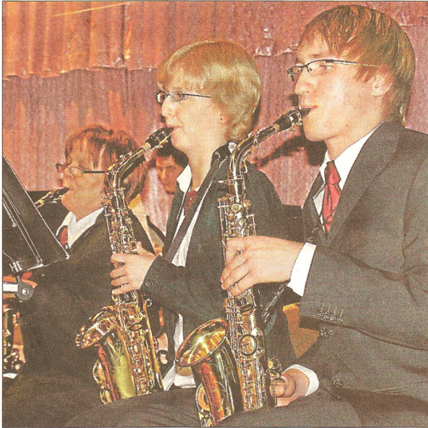
Die Blasmusiker des VfL Marburg zeigten im Gladenbacher Haus des Gastes ihr Engagement und Können.

keln. Mit gleicher Leidenschaft interpretierte das Blasorchester die Abenteuer der Ratte aus Ratatouille, segelte mit den Piraten in die Karibik und ging mit James Bond „007“ auf Verbrecherjagd. Für Freunde des eher romantischeren Filmgenres hatten die Marburger Blas-